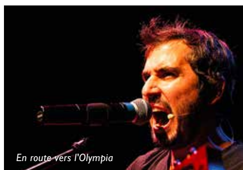
En route vers l'Olympia