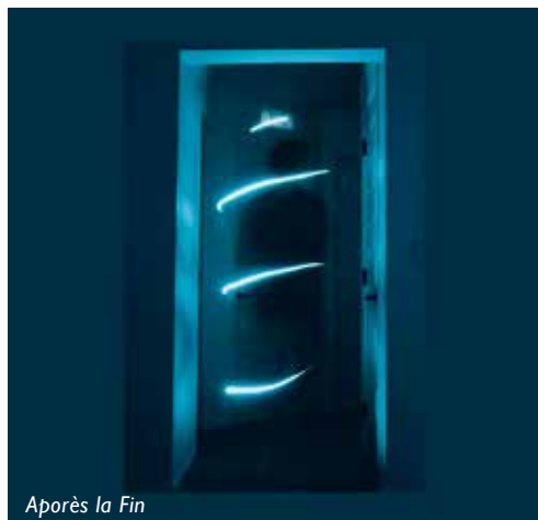
Après la Fin