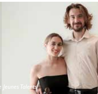
Carte Blanche Jeunes Talents