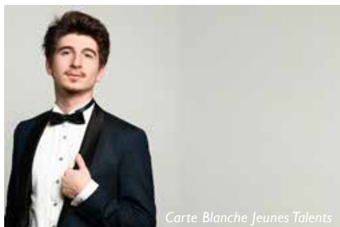
Carte Blanche Jeunes Talents