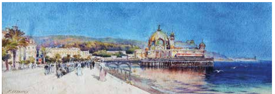
Ernest Lessieux Palais Jetée Promenade Aquarelle sur papier (circa 1920) Collection particulière

Jusqu'au 26 septembre www.museephoto.nice.fr