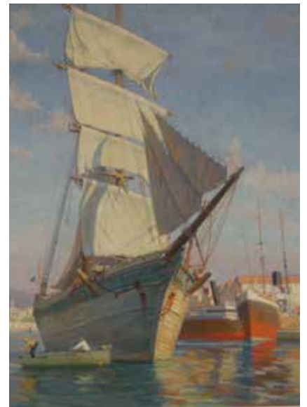
Charles Martin-Sauvaigo Voilier dans le port de Nice Huile sur toile (circa 1925) Collection particulière

Parfum d'antan à la bibliothèque Louis Nucéra. Sur place, une exposition en forme de pur ravissement distille au gré d'une centaine d'aquarelles, dessins et peintures les charmes de Nissa la bella et de son passé de grande coquette Belle Epoque. « Peindre Nice et sa région au XIX e et au début du XX e siècle », jusqu'au 21 septembre / accès libre / www.bmvr.nice.fr