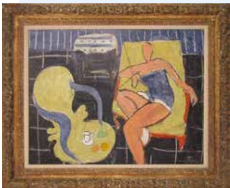
Henri Matisse Danseuse dans le fauteuil jaune, chaise vénitienne Huile sur toile, 50 x 65 cm Collection particulière © Succession H. Matisse

Jusqu'au 30 septembre www.musee-matisse-nice.org www.nice.fr