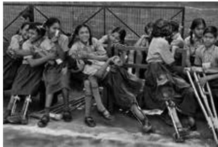
East Delhi Inde 2001