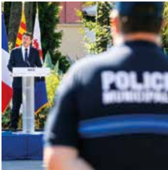
Christian Estrosi Maire de Nice Président de la Métropole Nice Côte d'Azur