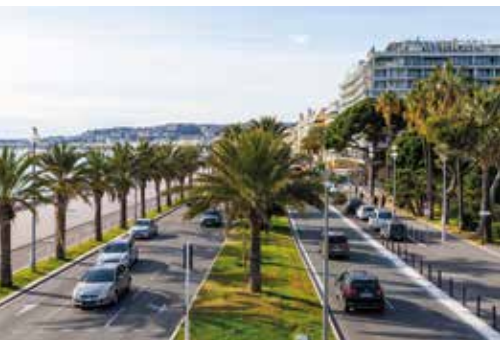
Double alignement de palmiers sur la Promenade des Anglais