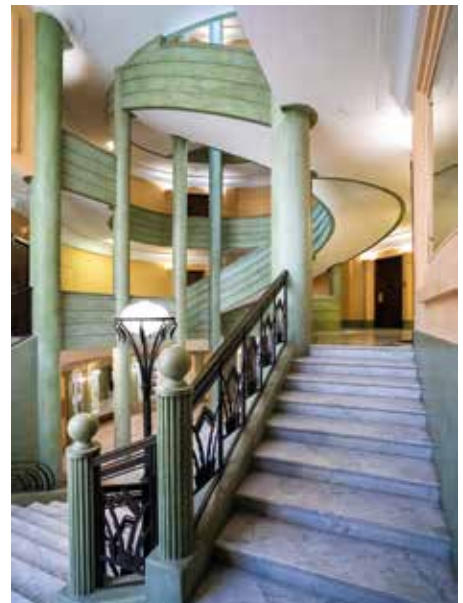
Escalier intérieur du Gloria Mansions