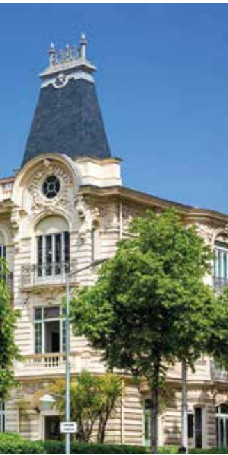
Ancien Hôtel Alhambra