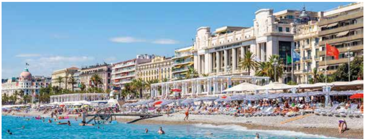
Plages privées sur la Promenade des Anglais