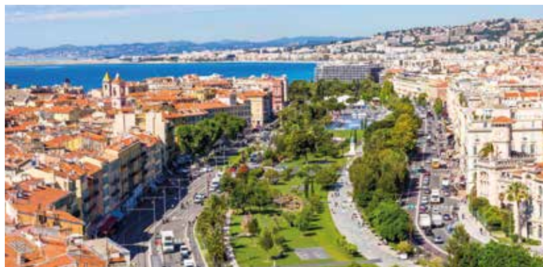
La Promenade du Paillon

à la tradition héritée du patrimoine turinois, en un mot, rendu à Nice son visage de beauté et de joie... et ce qui lui avait permis de séduire pendant près de deux siècles les responsables politiques les plus prestigieux, les chefs d'entreprises les plus inventifs, les artistes les plus audacieux venus du monde entier ». Désormais, l'âme de Nice est préservée. Par l'Humanité tout entière. Un véritable don pour les nouvelles générations qui auront la lourde charge de construire le patrimoine de demain, ces jeunes qui « feront les émotions, les méditations, les bonheurs de l'avenir sans trahir son identité profonde », détaillait Christian Estrosi. Avant de lancer un nouveau défi : « C'est donc avec la même détermination que je me consacrerai maintenant à soutenir la candidature de Nice au label de Capitale européenne de la culture 2028. »