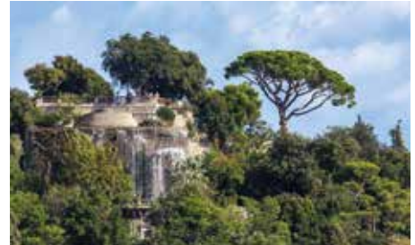
Cascade du Château