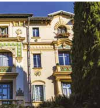
Flanc de la colline Carabacel