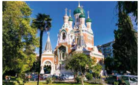
Cathédrale orthodoxe Saint-Nicolas