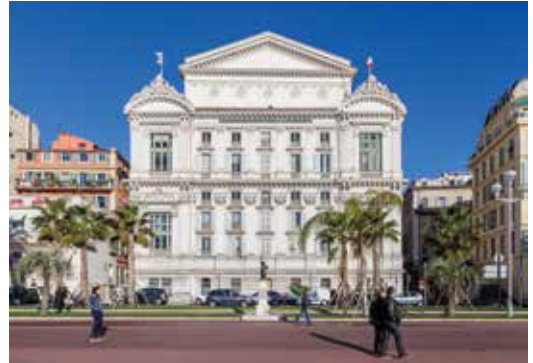
Opéra de Nice, façade sud

Bien évidemment, Nice est une destination touristique connue et reconnue. Bien entendu, son attractivité n'est plus à démontrer. Cependant, l'inscription au patrimoine mondial de l'UNESCO est un gage de prestige, en raison, notamment, de sa reconnaissance par la communauté internationale et d'une plus grande sensibilisation du public. Elle va inévitablement modifier certains paramètres en termes de développement touristique. Un atout supplémentaire sera mis en avant : la culture. Un « filon » qui permettra aux visiteurs de venir à la découverte de Nice et de son patrimoine quelle que soit la saison. Ce « tourisme patrimonial », de qualité, amènera incontestablement des retombées économiques. Une très bonne nouvelle pour l'économie locale, surtout en cette période de crise sanitaire. Mais aussi un retour vers le passé glorieux, celui de « Nice, la ville de la villégiature d'hiver de riviera ». Celui qui, aujourd'hui, lui a permis d'inscrire son nom au Patrimoine Mondial de l'UNESCO !