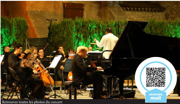
Retrouvez toutes les photos du concert