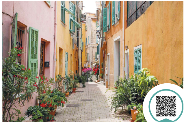
Retrouvez toutes les informations sur le site - www.villefranche-sur-mer.fr

Contact : Tél. : 04.93.76.33.55 - changement-usage@villefranche-sur-mer.fr