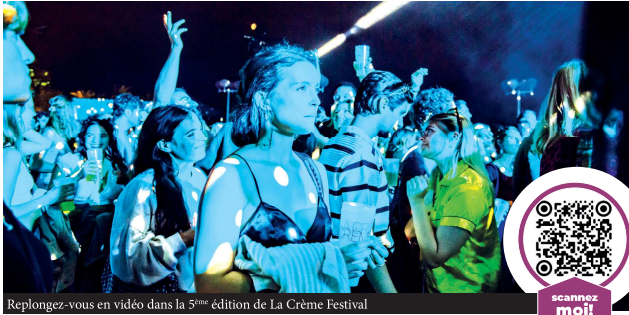
Replongez-vous en vidéo dans la 5 ème édition de La Crème Festival

Et entre le repas et les soirées endiablées, ils ont pu se détendre et découvrir la plus belle rade du monde avec des ateliers paddle, des initiations à l'apnée et des visites historiques du Port de la Darse !